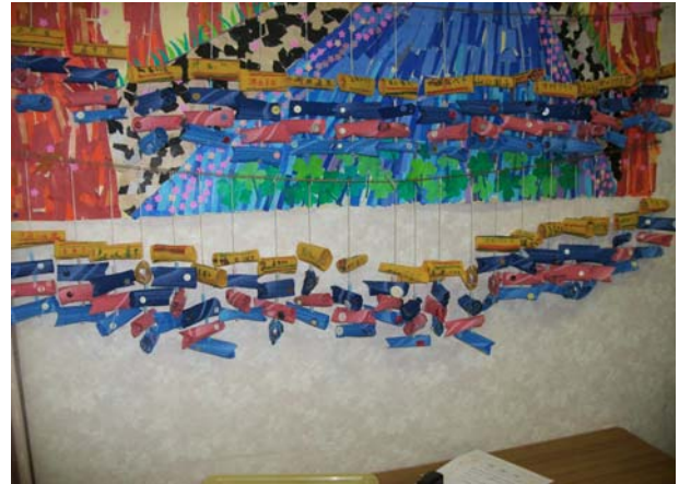
4月の月間工作「プチ鯉のぼり」完成品 もの凄い量の鯉のぼりたち 安心して子供の日を迎えます