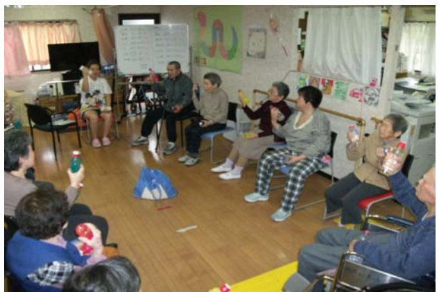
毎日15:30～始まる本格的な体操 これを楽しみに昼から来る人も 10:30～も違う体操をしています