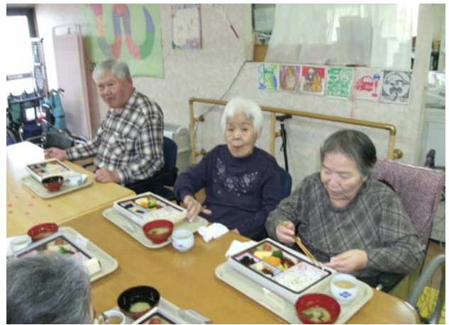
4月11日、センター特製幕の内弁当提供 いつもと違う器だから、気分も違う ちょっと量が多かったかも？