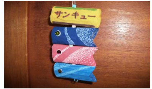
月間工作プチ鯉のぼり見本