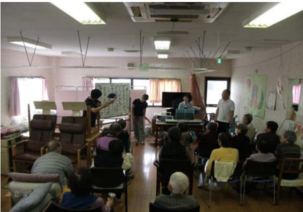
音楽療法ボランティアさん リズムに乗って色々な遊び