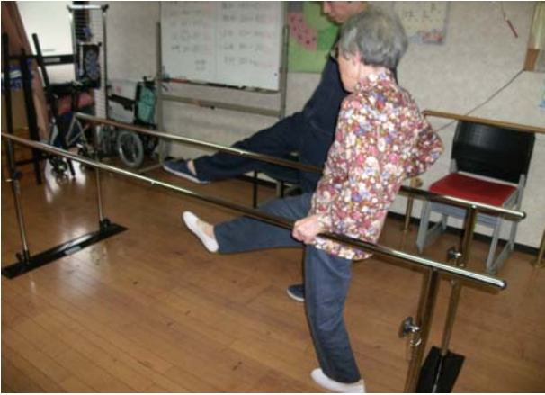
平行棒を使って機能訓練 先生がマンツーマン指導 楽しく実施中