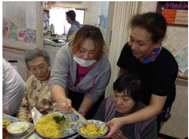
3月12日、てんぷらバイキングテスト試行 職員が大皿に盛った5種類のtempuraを テーブルに配食。食べ放題