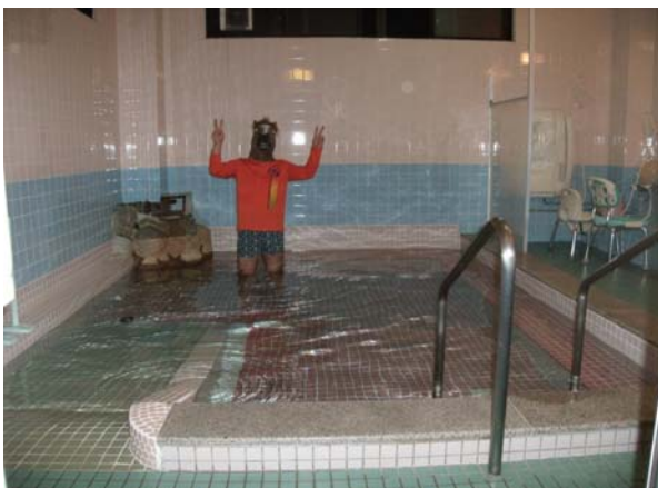
炭酸泉に改造する予定の大浴場 おわかり頂けますでしょうか 超大きいです 家庭用一般浴槽の20倍以上の湯量