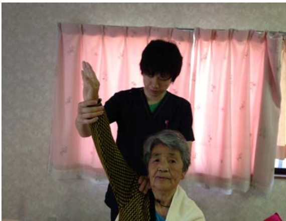
柔道整復師によるマッサージ 平日はいつもやってますので、お気軽に♪