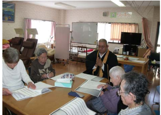
お坊さんによる読経※自由参加 発声練習もかねて、般若心経や 真言の経文を皆で一緒に読む