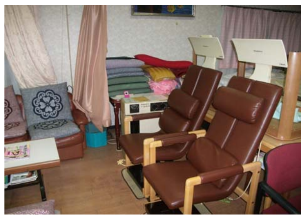
2月に導入されたヘルストロン お友達と二人で座ると楽しい 肩こり・頭痛・慢性便秘・不眠症によい